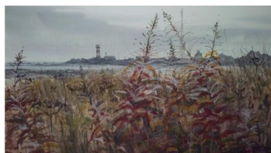
Терский берег, живопись, акварель, бум.