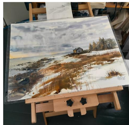
Проект «Два взгляда». Фотография Скалин Н. Живопись Беляева О.,