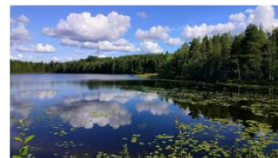
Кольский север, фотографии